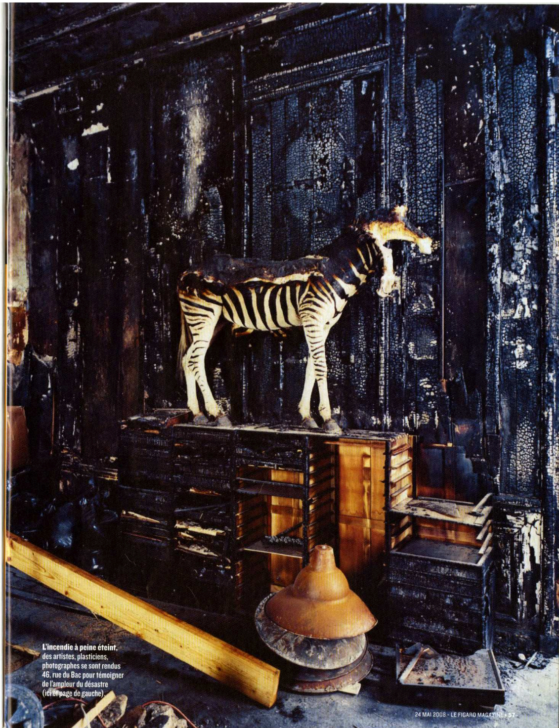
L'incendie à peine éteint, des artistes, plasticiens, photographes se sont rendus 46, rue du Bac pour témoigner de l'ampleur du désastre (ici et page de gauche).