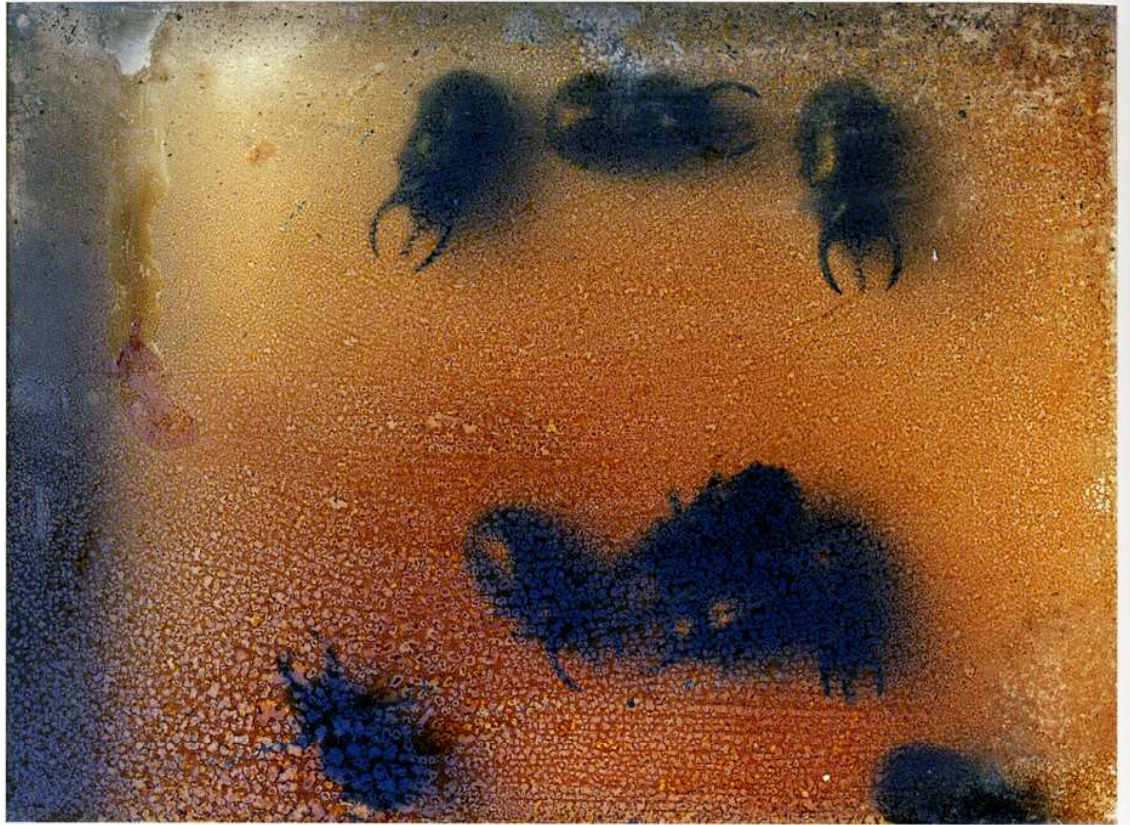
Fig. 5 Martin d'Orgeval, Chalcosma atlas (Touché par le feu) , 2008.